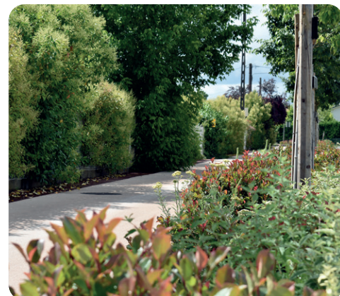
Pistes cyclables - Voies vertes